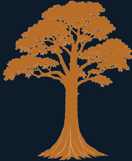
Iroko — Milicia excelsa