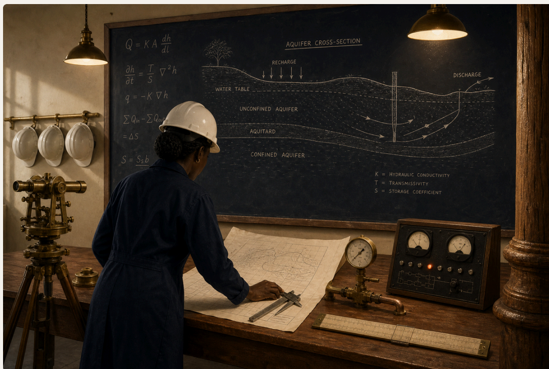
L'Académie Iroko Climat — pipeline de talents et actif souverain perpétuel.